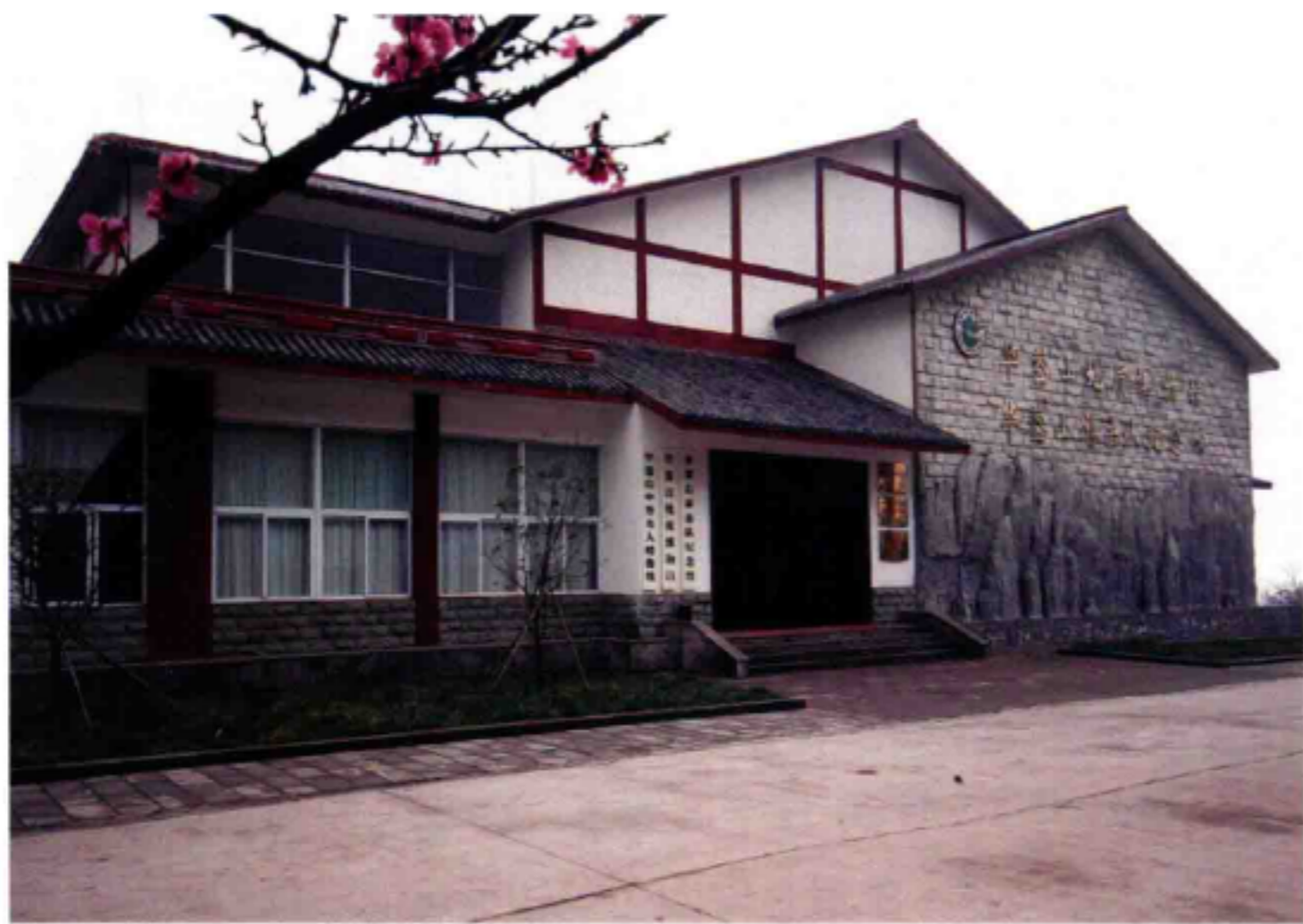
◆ 华蓥山游击队纪念馆

1920年代，党的地下工作者把革命火种带到了华蓥山。1931年秋，岳池特支决定由地下党员廖玉璧筹组华蓥山游击队，到1932年春，队伍发展到近500人。游击队活跃在渠河两岸及华蓥山麓的桂兴、天池、双河、阳和、高兴、观音溪一带，沉重地打击敌人，一直坚持战斗到1935年。