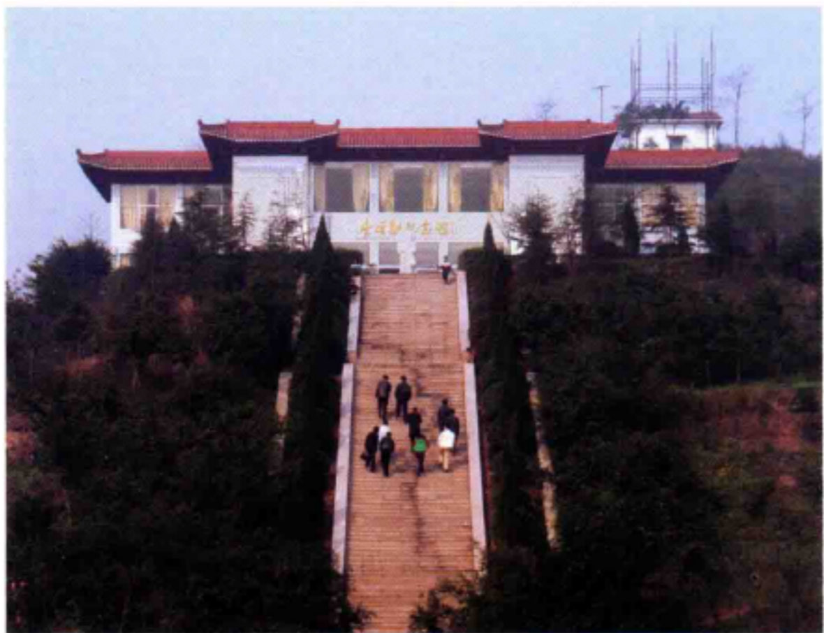
◆李硕勋纪念馆远景

李硕勋（1903—1931），又名李陶，1903年2月23日生于四川省庆符县（现为高县）。早年从事革命活动，1924年在上海大学加入中国共产党。1925年五卅运动期间，积极投身于上海街头的反帝爱国斗争，被选为上海学生联合会代表和全国学生联合会会长，同时他还以学生代表的身分参加领导了上海工商学联合会（中共领导下的统一战线组织）的工作。1925年至1926年，先后主持召开了第七届、第八届全国学生代表大会，还被选为上海反帝大同盟主席。1926年冬受党派遭到武汉，担任过中共武昌地委组织部部长、共青团湖北省委书记，不久又被派到国民革命军第4军第25师任政治部主任。1927年春率师主力之一部继续北伐，在河南上蔡战役大败奉军，后又回师武汉，参与平定夏斗寅叛乱。7月参加东下讨蒋。8月1日参加南昌起义，被任命为第11军第25师党代表兼政治部主任。后随起义部队南下广东，途中曾参与指挥会昌战役并取得胜利。同年10月受朱德委派，赴上海向党中央请示工作，被党中央留在上海从事党的白区工作。1928年4月被党中央派到武汉工作，因被敌人注意旋返上海，改任中共江苏省委秘书长。同年夏秋又到杭州，任中共浙江省委常委、省军委书记，后又任省委代理书记。1929年春再回上海，任中共沪西区区委书记。同年秋改任中共江苏省军委书记，和省委书记李维汉一起领导江苏的武装斗争，发动和领导了苏北的农民起义。