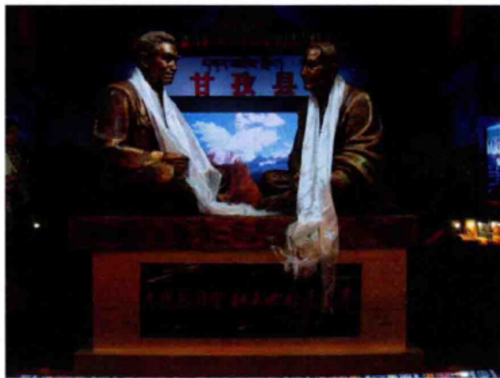
◆朱德总司令和五世格达活佛联谊塑像