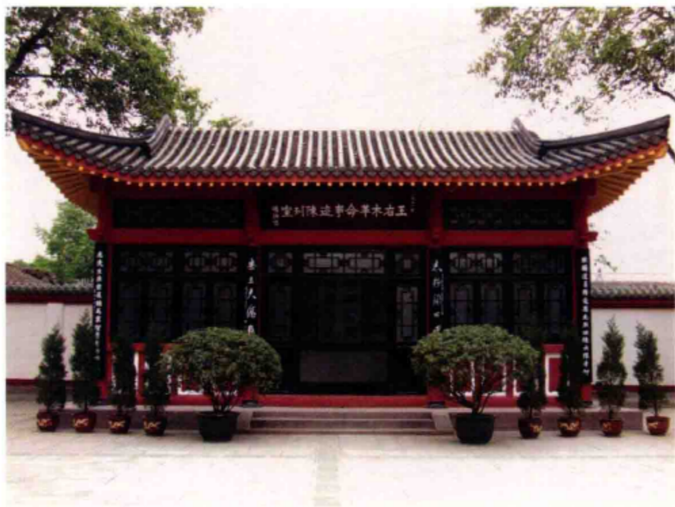
◆王右木革命事迹陈列室