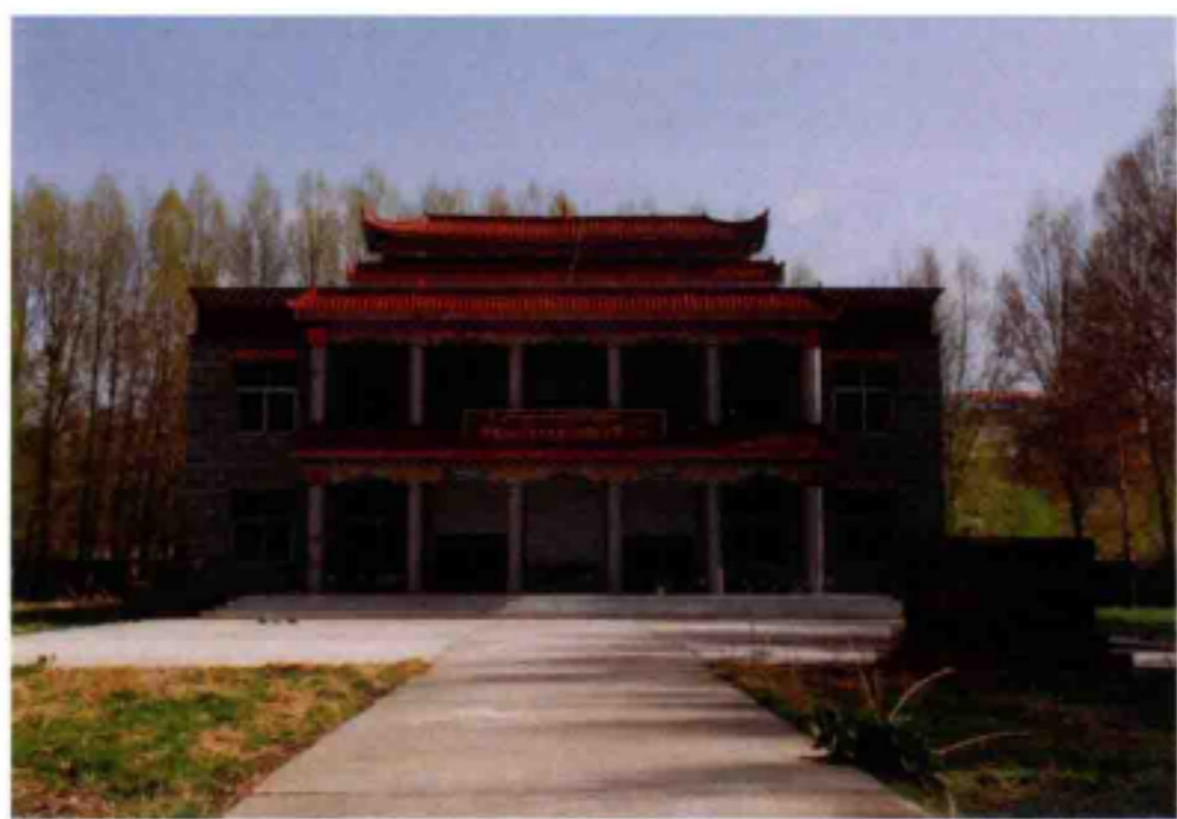
◆朱德总司令和五世格达活佛联谊塑像纪念馆

为了缅怀革命前辈、颂扬宗教爱国人士，经中央宣传部批准在甘孜县修建朱德总司令和五世格达活佛联谊塑像馆，选址在甘孜县甘孜镇河坝村旭日岭林地，于1991年8月22日举行了隆重的奠基仪式，1993年10月20日全面竣工。江泽民题写了馆名。馆内陈列了红军长征途经甘孜期间的革命文物，主要有中国工农红军长征路线图，红军途经甘孜州路线图，红四方面军路线图及有关照片、实物，红二、红四方面军到甘孜时军领导人相片，红二、红四方面军会师（绘画）图，有关会场遗址、居住遗址、活动遗迹的照片及相关实物（包括复制品）。朱总司令会见格达活佛塑像（还有绘画、照片、实物）。建立第一个民族地区苏维埃博巴政府（包括成立时的绘画、照片）。参加博巴政府的藏族群众的照片。详细介绍五世格达活佛的生平和组织动员群众积极支援红军英雄事迹等。