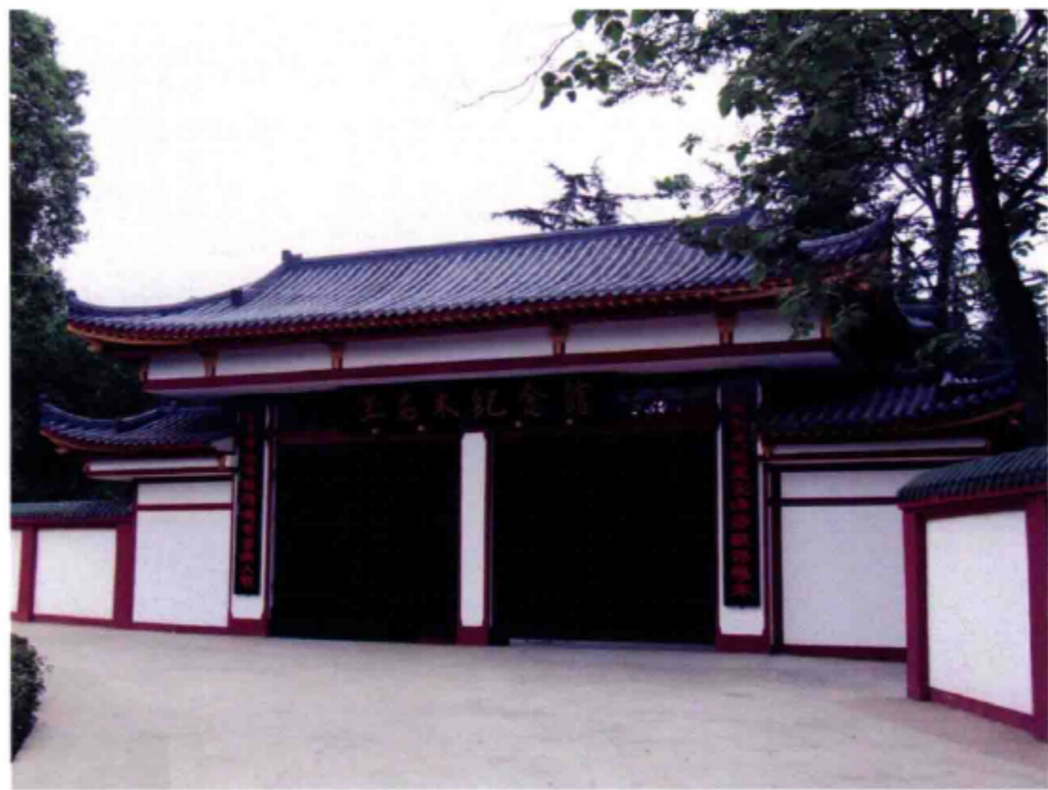
◆王右木纪念馆大门

王右木（1887—1924），原名王丕昌，又名王燧。四川省江油市武都镇人。1911年考入成都通省师范学堂数理科，以优异成绩毕业后被选拔为官费生考入日本东京明治大学经济系。1918年获经济学士学位，归国回川任成都高等师范学堂学监，并教日文。1920年底组织成立马克思主义读书会，吸收部分大中学生、教员、记者等阅读社会主义书籍和《新青年》等进